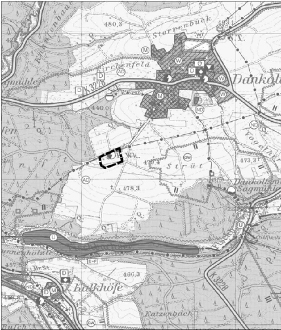
Abgrenzungsplan 31. Änderung FNP der VVG Ellwangen Jagstzell > Pumpwerk Dankoltsweiler < (FNP-Bestand vor Änderung)