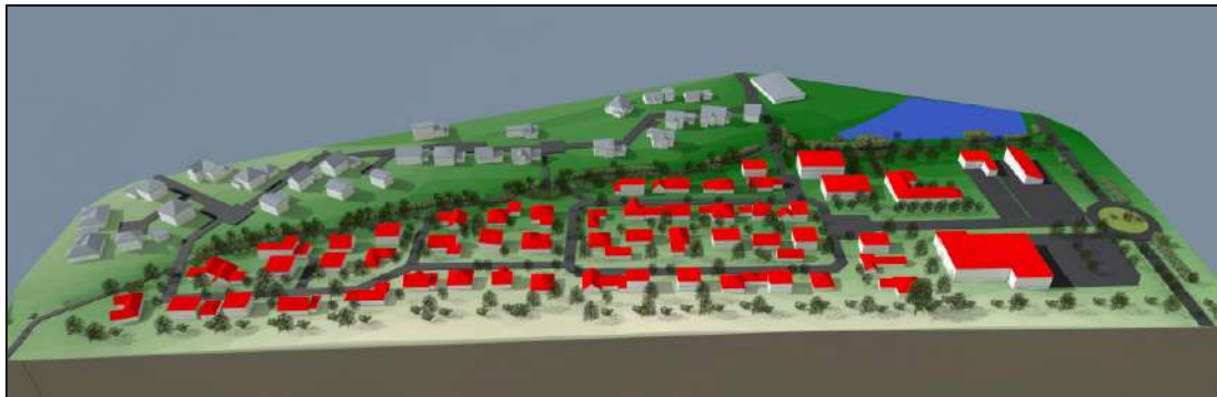
Bild 6: städtebauliches Strukturkonzept, unmaßstäblich

Unter diesem Aspekt ist die Aufstellung dieses Bebauungsplanes erforderlich. Durch die Planung sollen die planungsrechtlichen Grundlagen für die Bebauung unter dem Aspekt einer städtebaulich geordneten Entwicklung geschaffen werden.