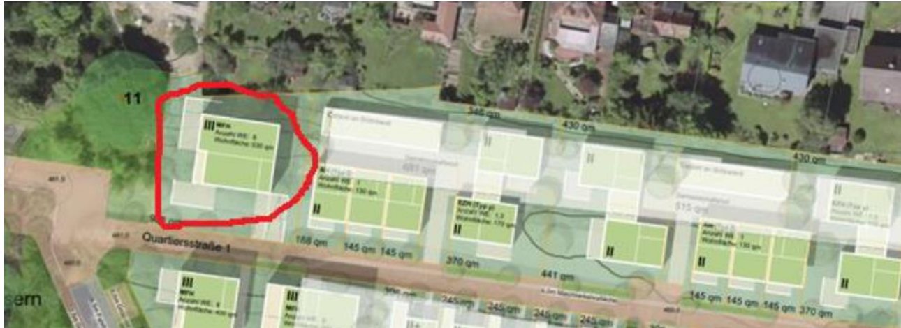
Bild: Aktueller Bebauungsplan – in rot eingekreist die Fläche auf die sich der oben ausgeführte Widerspruch primär bezieht.

und Geländeschnitt). Zudem besteht ausreichend viel Abstand zwischen den bestehenden beiden Gebäuden und dem neu geplanten Gebäude. Die städtebauliche Konzeption des mehrgeschossigen Gebäudes am Eingang zum Plangebiet ist schlüssig und es entstehen keine unzumutbaren Beeinträchtigungen. Dem Wunsch einer Beibehaltung der bestehenden Eingrünung des bestehenden Grundstücks nach Süden kann nur teilweise Rechnung getragen werden durch Festsetzungen zum Erhalt von Bäumen und Festsetzungen zur Neuanpflanzung von Bäumen südlich des bestehenden Grundstücks. Ergänzend kann auf dem bestehenden Privatgrundstück geprüft werden, ob dort selbst weitere Bäume möglich sind.