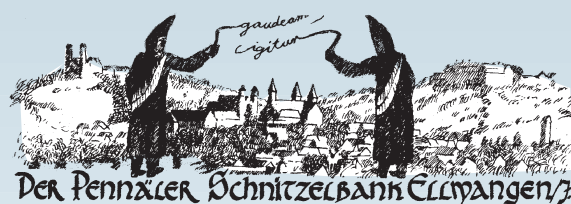
DER PENNÄLER SCHNITZELBANK ELLWANGEN

Für die Finanzierung des Umzugs wird auch in diesem Jahr wieder eine Fastnachtsfigur am Fastnachtssonntag und am Umzugsdienstag verkauft. Die Figur zeigt ein Mitglied des FCV Männerballett. Die bemalten Figuren werden am Fastnachtssonntag zum Preis von 3 €, die unbemalten Figuren am Fastnachtsdienstag zum Preis von 2,50 € verkauft. Den Verkauf übernimmt in diesem Jahr der Förderverein St.-Georg-Halle Schrezheim e.V.