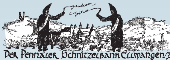
Der Pennäler Schnitzelbank Ellwangen

Dann schlängelt sich ein fröhlich bunter Gaudiwurm durch die Straßen der Stadt. Originelle Fußgruppen animieren zum Mitmachen, tanzen, feiern sich und den Umzug. Sie bestimmen das Bild, doch sind auch die aufwendig gestalteten Wagen ein Augenschmaus für die Zuschauer. Nach dem Umzug heißt es, die letzten Stunden nochmals so richtig zu feiern, denn um Mitternacht ist Schluss des Feiertamels. Der Abschied erfolgt in Ehren, die Fastnacht wird zu Grabe getragen: Die "Trauergemeinde" marschiert im Fackelschein auf den Marktplatz, wo die Fastnacht nach einer feierlich Grabrede den Flammen übergeben wird.