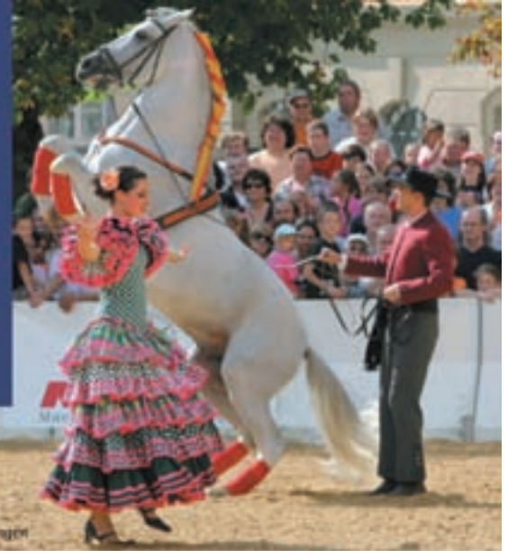
Reitstall Petra, Nördlingen